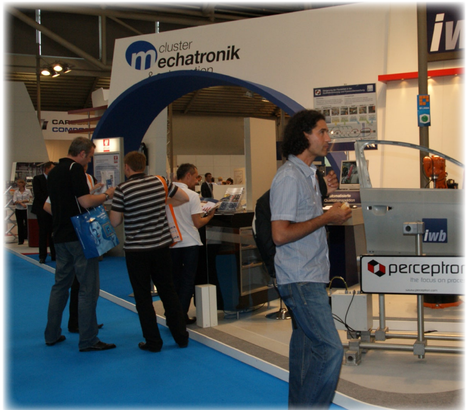
Gemeinschaftsstand des Cluster Mechatronik & Automation e.V. auf der AUTOMATICA 2010.

Mehr Messepräsenz, mehr Fachpublikum und Fachpresse-Vertreter am Stand und die Möglichkeit, hier die Zusammenarbeit mit Mitgliedern und Partnern im Verein zu vertiefen oder neue, spannende Kontak-