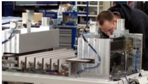
Maschinen und Anlagen für die Druckindustrie