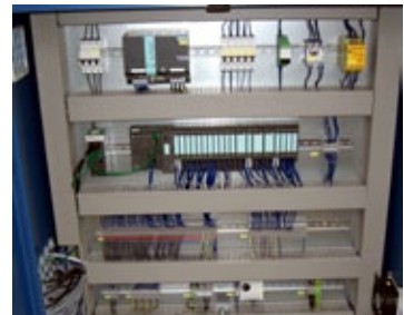
Schaltanlagen und Steuerungen