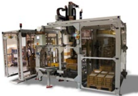
Handlingsystem für Kuvert-Boxen