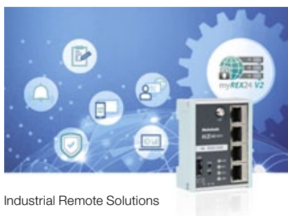
Industrial Remote Solutions