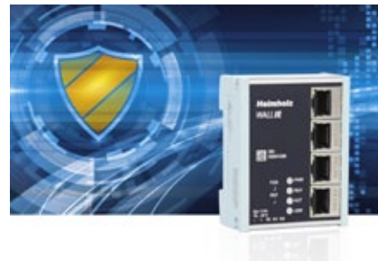
WALL IE - Industrial Ethernet Bridge und Firewall