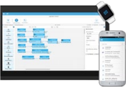
Die Digitalisierungsplattform für mobile Lösungen