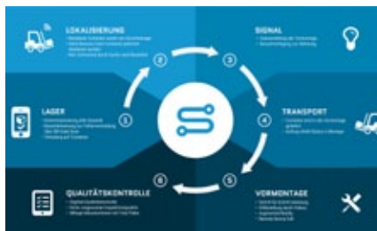
Digitale Vernetzung von Prozessen in der Produktion (Big Picture)