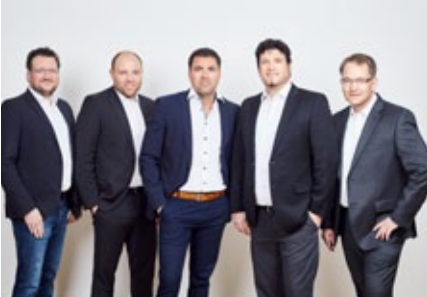
Management in der iTiZZiMO AG