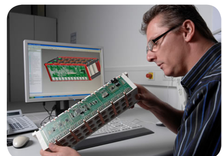
Entwicklung von Batteriemodulen für Hybridfahrzeuge am Fraunhofer IISB.