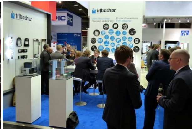
(Irbacher, electronica 2016) Individuelle Wandgestaltung, eigenes Messe- mobilier, eigene Podeste und Vitrinen