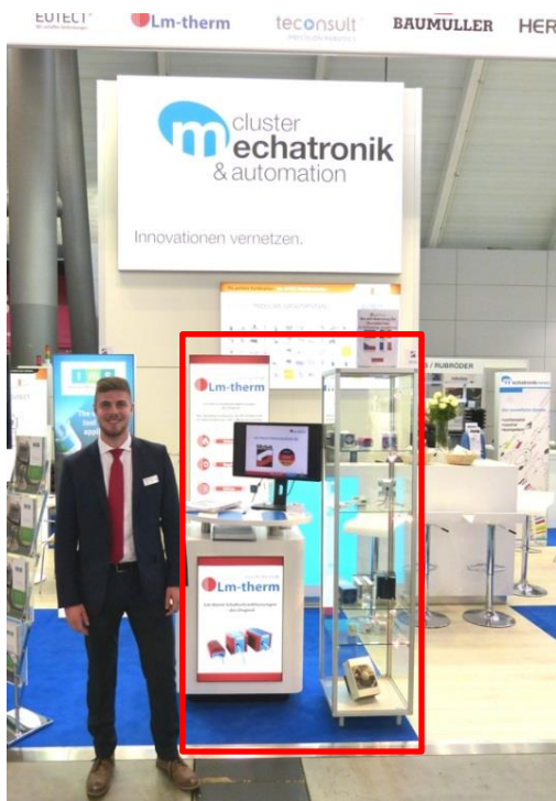
(Lm-therm Elektrotechnik AG, MOTEK 2016)

Bild zeigt Sonderausstattung: Beleuchtete Glasvitrine, hinterleuchtetes Firmenlogo im Counter