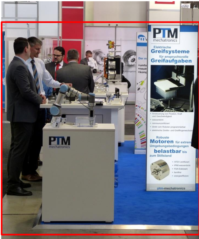
(PTM mechatronics GmbH, MOTEK)

Bild zeigt eignes Messeequipment des Ausstellers: Podest mit UR-Roboterarm, dahinter weiteres Podest mit Exponaten (im Hintergrund Pole Position des Mitausstellers RoboDrive / TQ Systems)