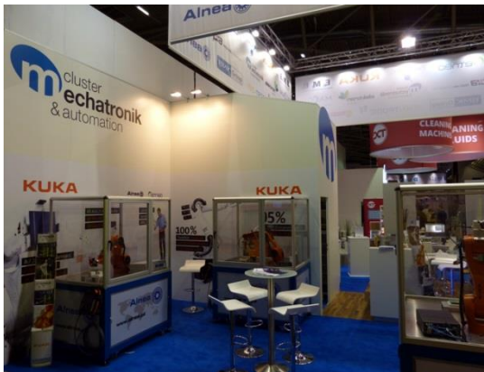
(KUKA, productronica 2015) Individuelle Wandgestaltung, Roboterzellen Stehtisch und Barhocker vom Cluster