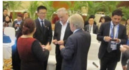
Bayern Forum Chengdu China 2016