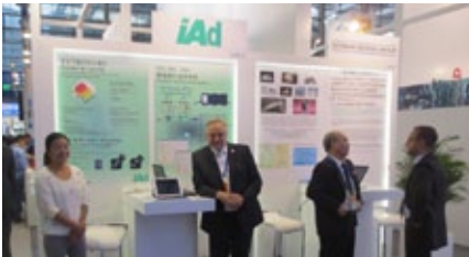
China High Tech Fair 2016