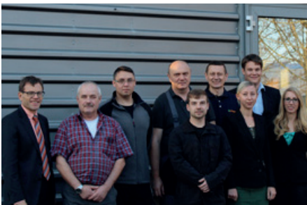
Das Team der 4Linear GmbH