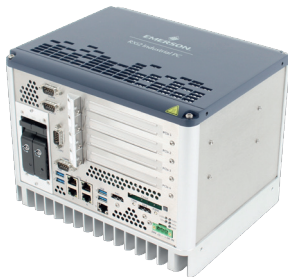
Emerson Industrial Computing - IPC 4 Slots RAID