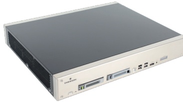
Emerson Server (AMD EPYC-3251)