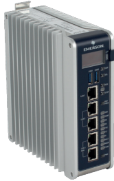
Emerson CPL410 Controller