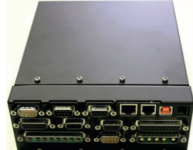
SWM universeller Motorcontroller