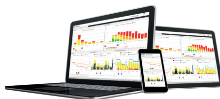
Das Software-Tool MiG bringt Durchblick in die Materialwirtschaft