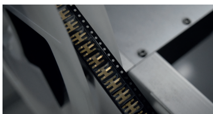
Tape&Reel: Lagerrichtige, sortenreine Gurtung