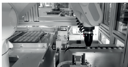
Engineering: Automatisierte Bausteinsortierung