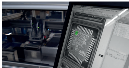
Bauteilprogrammierung: Qualitätskontrolle durch HD-Kamera