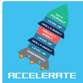
Training und Coaching (Organi- sation-, Team-, Infrastrukturent- wicklung, Qualitätssicherung)