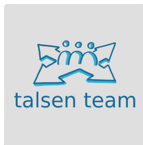
Ihr Beschleuniger für die indus- trielle Softwareentwicklung