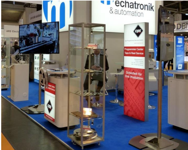
(cps Programmier-Service GmbH, electronica 2018)

Bild zeigt Sonderausstattung: Beleuchtete Vitrine, 2 x Monitor 55“ mit Standfuß