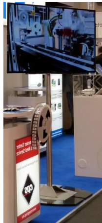
Monitor 55" freistehend