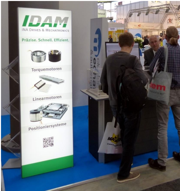
(INA Drives & Mechatronics AG, MOTEK 2017)