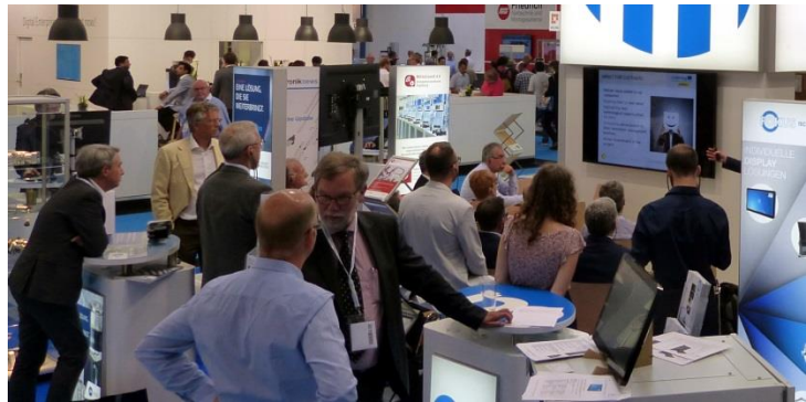
Monitor 75" – mit und ohne Veranstaltung