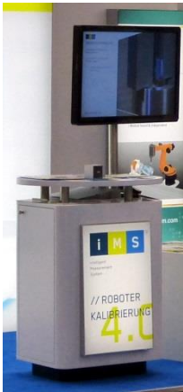
Monitor 43" aufgeständert