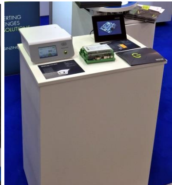
Podest Standard mit Fach für Werbegeschenke etc.