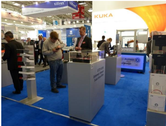
(Beckhoff und KUKA, productronica 2017) Individuelle Wandgestaltung, Roboterzellen eigene Messemöbel