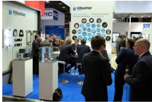
(Irlbacher, electronica 2016) Individuelle Wandgestaltung, eigenes Messe- mobilier, eigene Podeste und Vitrinen